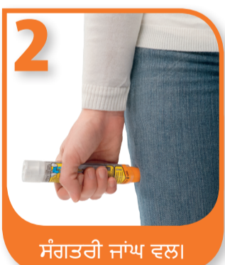
ਸੰਗਤਰੀ ਜਾਂਘ ਵਲ।