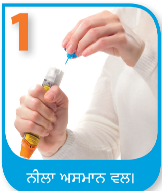
ਨੀਲਾ ਅਸਮਾਨ ਵਲ।

ਮੈਂ EpiPen® ਅਤੇ EpiPen® Jr ਆਟੋ-ਇੰਜੈਕਟਰ ਦੀ ਵਰਤੋਂ ਕਿਵੇਂ ਕਰਾਂ।